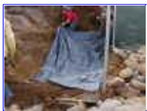
Ref: Fácil-2- 04

03 - Estando pronto a cava, estique a manta de pvc especial para laguinhos, faça com que as bordas sejam alcançadas pela manta esticando-a. Lembre-se de verificar se não há torrões ou pedras na cava antes de colocar a manta.