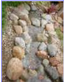
Ref: Fácil-2- 22

22- O riozinho ou corredeira também será feito com plástico ou lona de pvc, note que a bordadura também foi feita e que no fundo você colocará pedras miúdas para evitar que a água passe por baixo de pedras grande e a água não apareça.