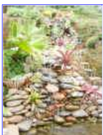
Ref: Fácil-2- 21

20- Para cada caso projetamos um equipamento pré-montado, dependendo das medidas e condições de uso. Este equipamento já será fornecido montado e basta submergir na água.