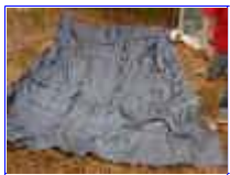
Ref: Fácil-2- 05

04 - Aproxime as pedras da sua cava já com a manta, se suas pedras estiverem sujas de terra ou areia de obra ou de rio, lave-as com água antes de colocar na sua fonte.