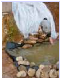
Ref: Fácil-2- 18

17- Com uma manta plástica você poderá cobrir o barranco, mas antes faça uma cava na vertical.