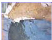
Ref: Fácil-2- 08

07- Agora você vai encher com água, até que fique próximo da borda, não encha muito pois quando colocarmos as pedras um pouco de água vai vazar para fora.