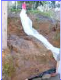
Ref: Fácil-2- 16

16- Se no seu jardim tiver um barranco, ou uma elevação de terra, poderá construir uma cachoeira facilmente, caso não tenha use a terra que saiu do buraco para criar esta elevação.