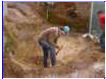
Ref: Fácil-2- 01

01 - Cave um buraco em forma de concha, mantenha o fundo com aproximadamente 50cm de profundidade. Retire torrões e pedras, deixe o fundo liso, não precisa socar ou firmar a terra, basta cavar.