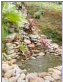
Ref: Fácil-2- 23

22- O riozinho ou corredeira também será feito com plástico ou lona de pvc, note que a bordadura também foi feita e que no fundo você colocará pedras miúdas para evitar que a água passe por baixo de pedras grande e a água não apareça.