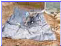
Ref: Fácil-2- 06

05 - Estique a manta, mas é natural que ela fique um pouco enrugada, apenas puxe de cada lado para que evite as dobraduras desnecessárias.