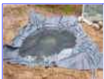
Ref: Fácil-2- 07

06 - Limpe por dentro, retirando torrões e a terra que pro ventura tenha entrado. Prepare a superfície de forma a entrarmos agora no acabamento.