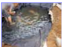
Ref: Fácil-2- 09

08- Levante a borda da manta com água e coloque umas pedras, de forma que a manta fique para cima. Veja que as pedras por trás forcem a manta contra a água.