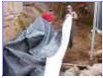
Ref: Fácil-2- 03

02 - Enquanto você estiver cavando, faça um borda mais alta na beira do espelho de água. Evitando que a água da chuva entre no seu lago trazendo terra ou folhas e ramos. Esta borda contornará todo o espelho de água.