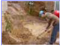
Ref: Fácil-2- 02

01 - Cave um buraco em forma de concha, mantenha o fundo com aproximadamente 50cm de profundidade. Retire torrões e pedras, deixe o fundo liso, não precisa socar ou firmar a terra, basta cavar.