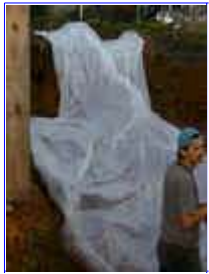
Ref: Fácil-2- 17

16- Se no seu jardim tiver um barranco, ou uma elevação de terra, poderá construir uma cachoeira facilmente, caso não tenha use a terra que saiu do buraco para criar esta elevação.