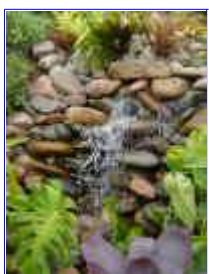
Ref: Fácil-2- 24

23- O equipamento moto-bomba poderá ter um filtro de perlon acoplado ou então a água passará por um filtro biológico. Dependendo sempre de cada caso. Nós faremos todas as especificações para você de forma fácil e descomplicada.