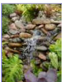
Ref: Fácil-2- 24

23- O equipamento moto-bomba poderá ter um filtro de perlon acoplado ou então a água passará por um filtro biológico. Dependendo sempre de cada caso. Nós faremos todas as especificações para você de forma fácil e descomplicada.