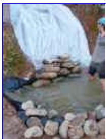
Ref: Fácil-2- 19

18- O plástico ou a Manta do barranco devem ficar por cima da manta de baixo, pense sempre no sentido da água, é claro que você não quer que a água saia por fora do laguinho.