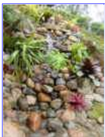
Ref: Fácil-2- 20

19- Após ter feito a cava deite o plástico cobrindo toda a área onde você colocará as pedras. Recorte sobras excessivas e monte assim a sua cachoeira. Observe que as pedras mais achatadas servirão melhor para estrutura da cascata.