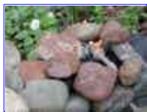
Ref: Fácil-1 -19

19- O registro de entrada de água deverá ficar num local de fácil acesso, assim também o registro de esgoto.