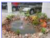
Ref: Fácil-1 -24

Nós faremos todas as especificações para você de forma fácil e descomplicada.