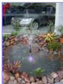
Ref: Fácil-1 -21

20- Com pedras ou plantas você esconde o registro. Para esgotar, ligue a bomba, abra o registro de esgoto. Para encher abra o registro de entrada e feche o de esgoto. Para trocar a água, abra o registro de entrada e de esgoto, observe por alguns minutos a troca da água e em seguida feche o registro de esgoto e de entrada e a sua água está nova e limpa.