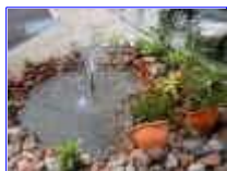
Ref: Fácil-1 -22

Você pode adquirir o seu equipamento com bico chafariz com vários tamanhos, de acordo com o diâmetro do espelho d'água.