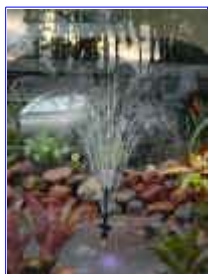
Ref: Fácil-1 -23

22- A iluminação subaquática tem cores verde, azul, âmbar (alaranjado), vermelho e luz branca. O holofote subaquático já estará pronto para uso submerso, com cabos e transformador em 12 volts.