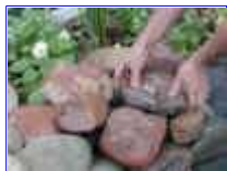
Ref: Fácil-1 -20

Oculte o registro, apenas cubra com umas pedras ou plantas.